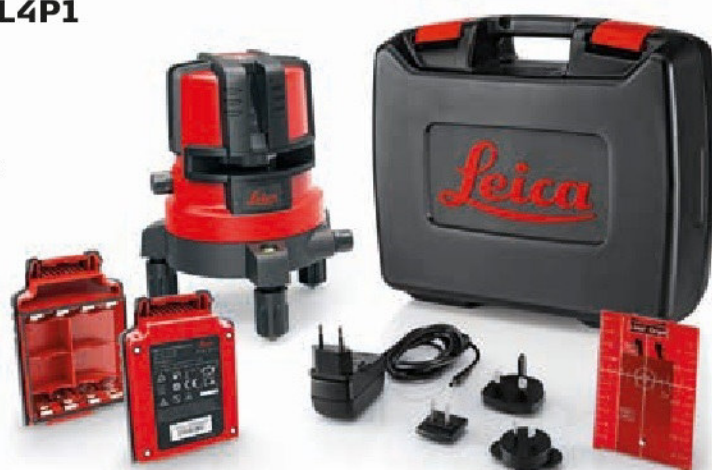
Leica Lino L4P1 package codice articolo 834838